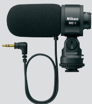
Micro stéréo ME-1