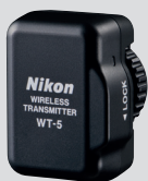
Transmetteur WiFi WT-5