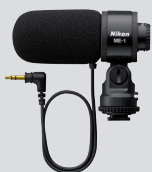
Micro Stéréo ME-1